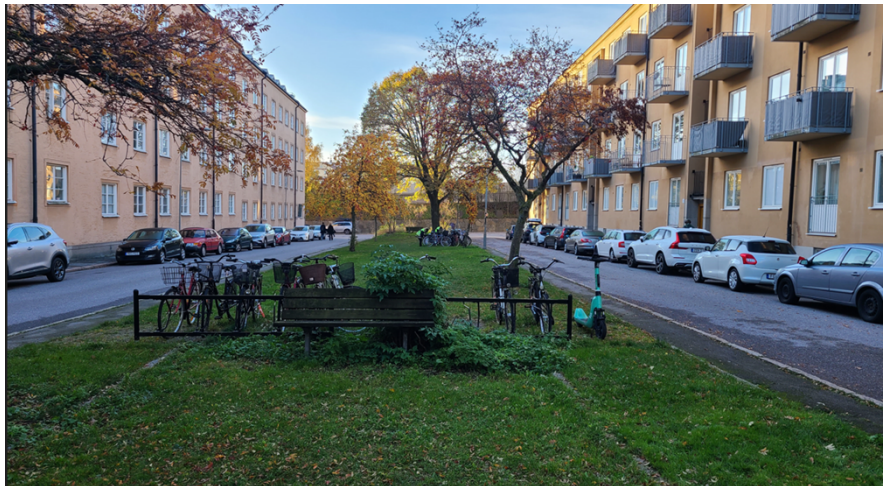
Parken sedd från norr. En gammal parksoffa, cykelparkeringar och små rönträäd.

På senare år har flertalet cykelställ tillkommit på gräsyterna och genom hela platsen står cyklar parkerade vilket ger ett stökigt och otrivsamt intryck. Det har bildats smitvägar över gräsytan, som fungerar som stråk till och från tunnelbanan vid Nordenflychtsvägen.