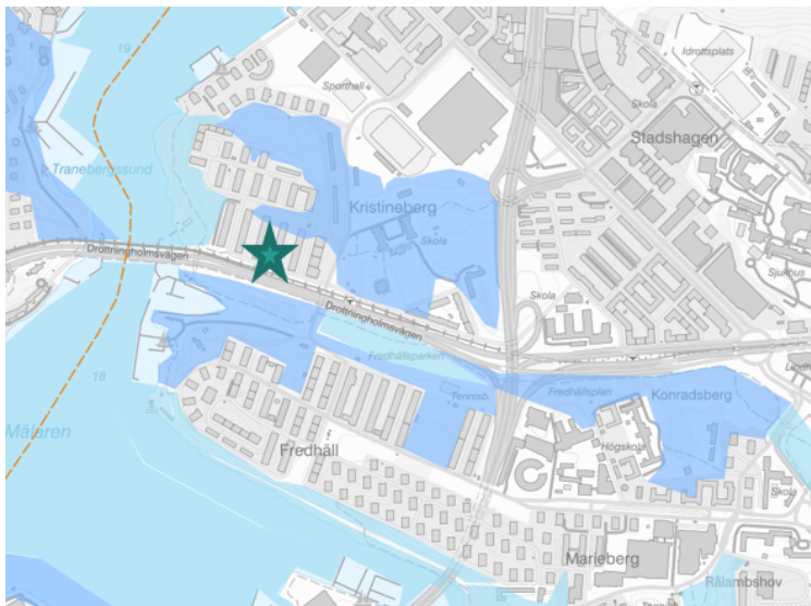
De blåa ytorna på kartan är ekologisk särskilt betydelsefulla områden (ESBO).

Ola Hanssonsgatan utgör en länk mellan två stycken så kallade ESBO-områden, det vill säga områden som är ekologiskt särskilt betydelsefulla. Att förnya parkstråket och arbeta för en större krontäckning och ökad artvariation, är därför något som kan stärka spridningssambanden i Kristinebergs värdefulla naturmiljöer.