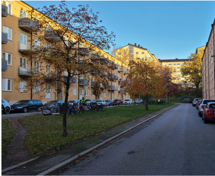
Smitväg över gräsytan och den smala remsan med asfalt som omgärdar platsen.