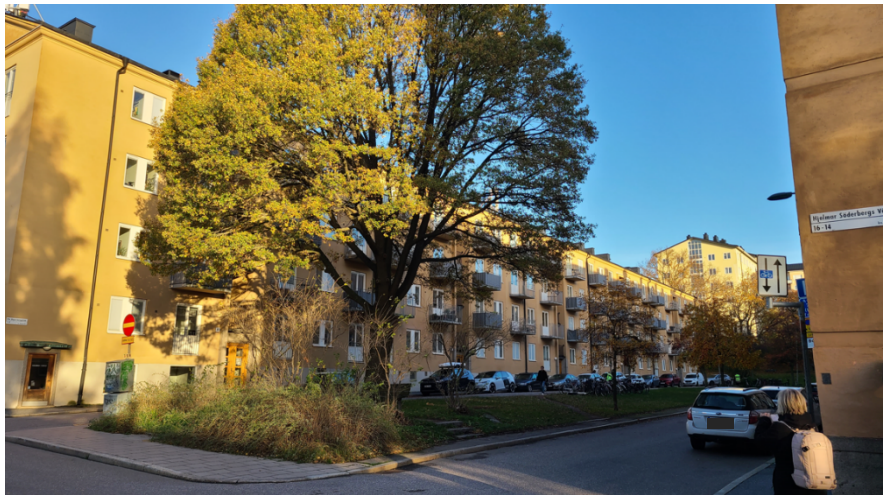
Parken sedd från söder, vid Hjalmar Söderbergs väg, med den praktfulla eken i blickfånget.